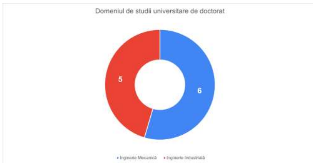
Număr respondenți pe domenii de studii universitare de doctorat

studenților doctoranzi cu privire la calitatea activităților didactice și de cercetare desfășurate în cadrul. Au fost obținute următoarele rezultate cantitative: